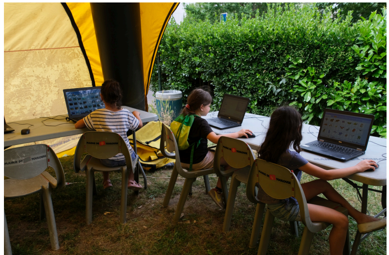
Graine de Labo par Léo Lagrange