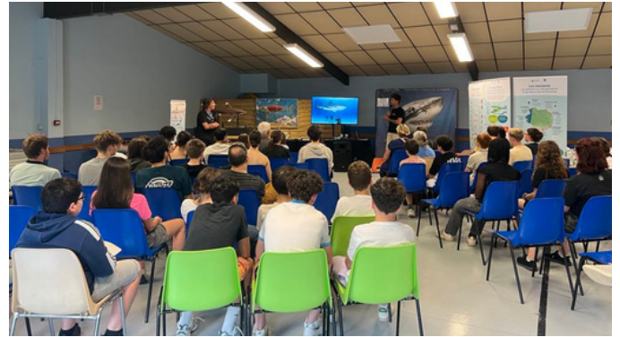
Conférence sur les requins