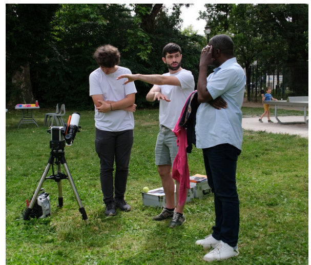
Observations du soleil et soirée astro avec UPS in Space